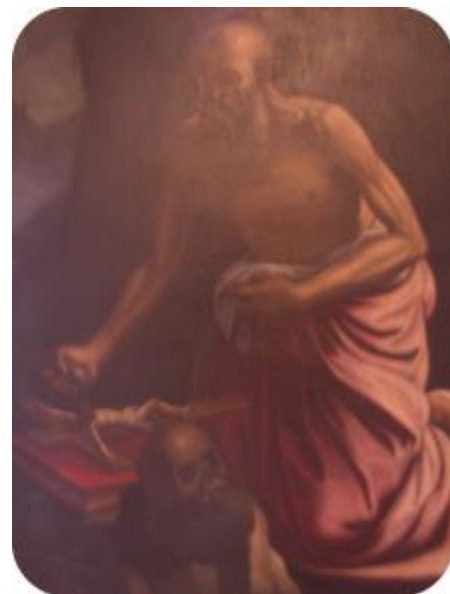
Restauration peinture de Saint Jérôme

La Mairie vous accueille Lundi de 9 h à 12 h Jeudi de 14 h à 17 h 30 et sur R.DV au 01.64.35.66.76 www.dhuisy-village.com